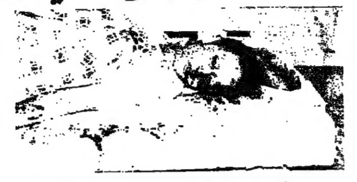
القنبلة المجهولة

طرابلس - من مكتب «الاتوار» : ظهر احد الرماة صباح امس ، على جثة امرأة مجهولة الهوية ، على شفة النهج الكبير في عكار ، وهي مصابة بثلاث طلقات نارية في راسها وصدرها وفخذها . ونقل الرامي الخبر الى رجال الدرك والتالي قتلها .